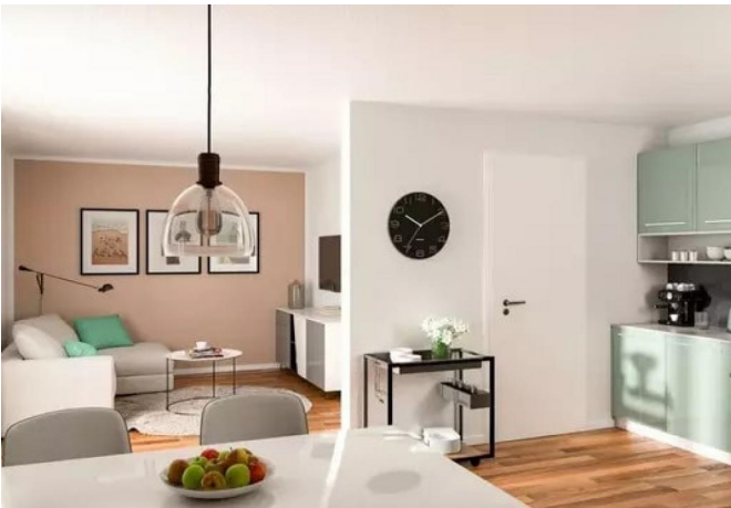
Beispiel Wohn- Essbereich