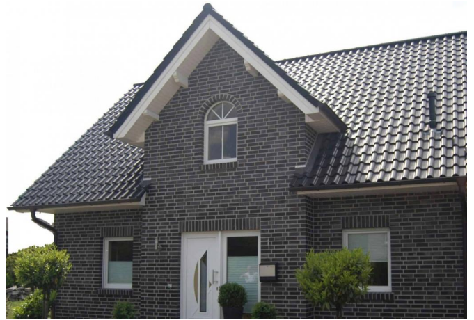
Beispiel realisierter Hausbau