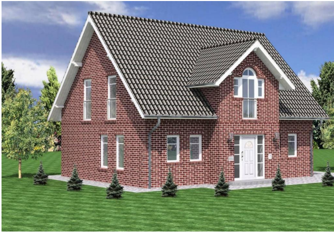
Beispiel mit rotem Verblender