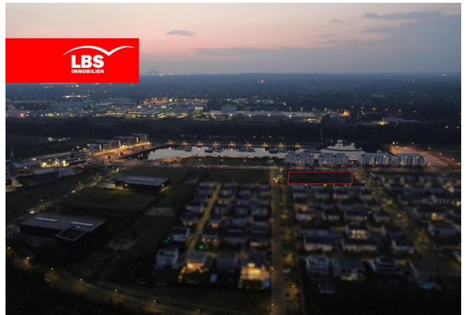
Graf Bismarck bei Dämmerung