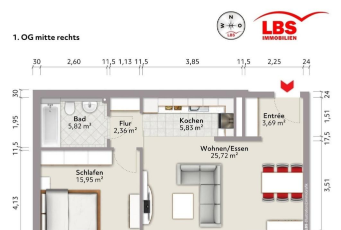
Grundriss Wohnung 27