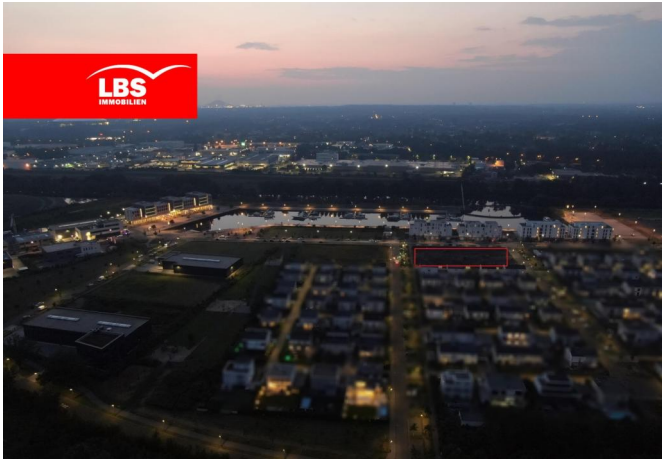
Graf Bismarck bei Dämmerung