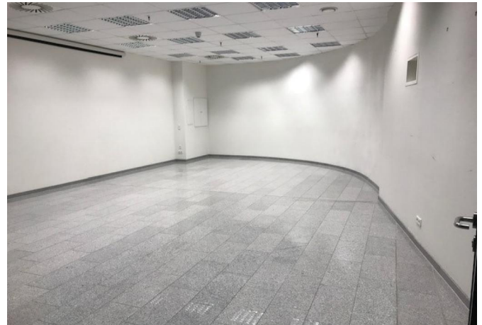
Saal - Großraumbüro