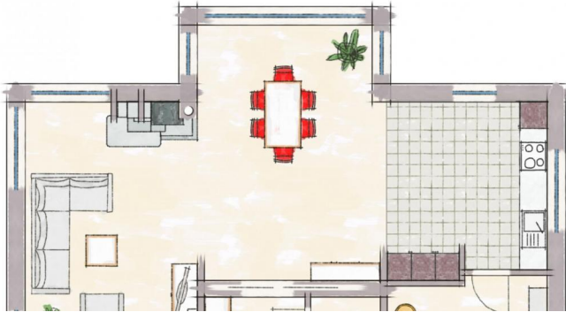
Grundriss Erdgeschoss EFH/ZFH