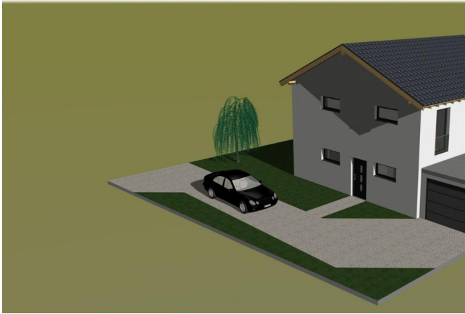
Visualisierungssicht 2 (1)