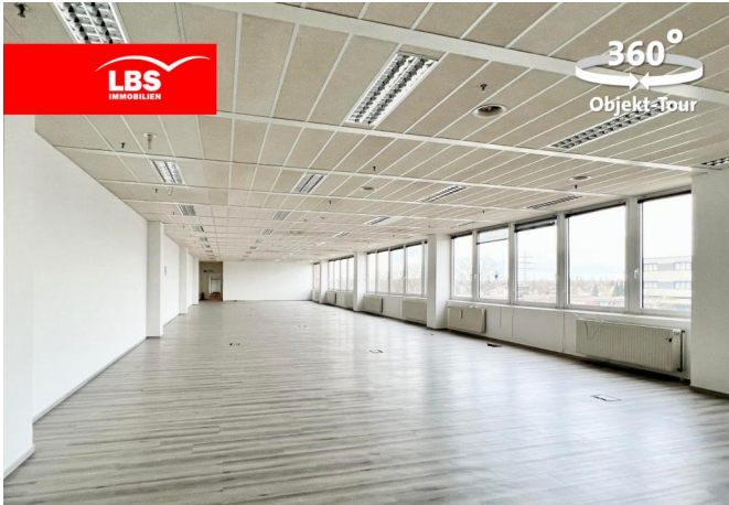
Buchhaltung / Raum 2