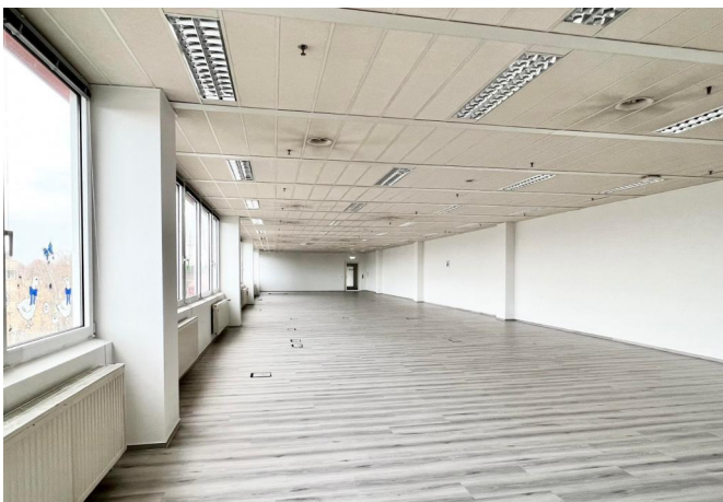
Buchhaltung / Raum 2