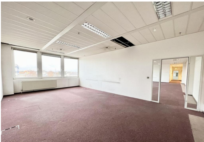
Raum 4 - Chefbüro