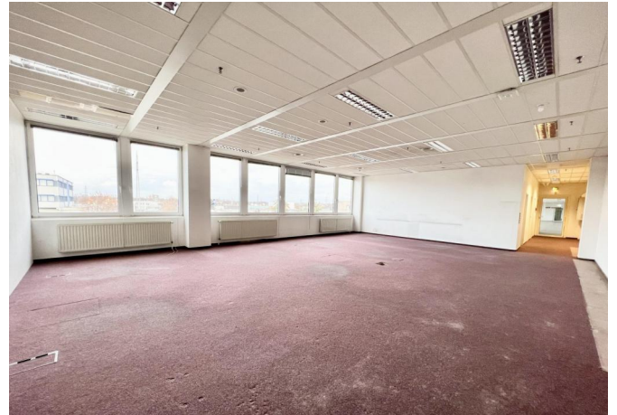
Rechnungsprüfung - Raum 3