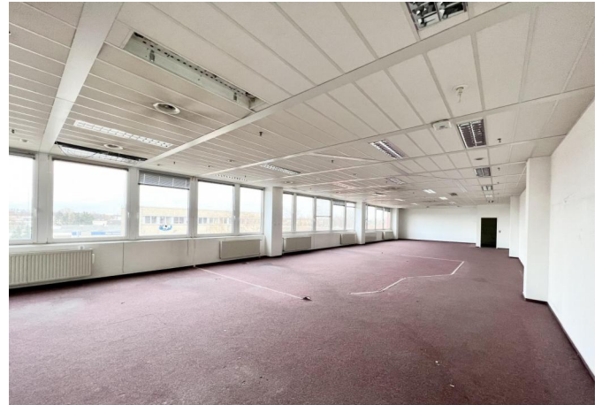
Geschäftsleitung / Gruppenraum - Raum 1