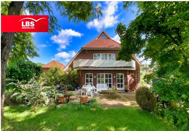
Blick auf Terrasse und Balkon