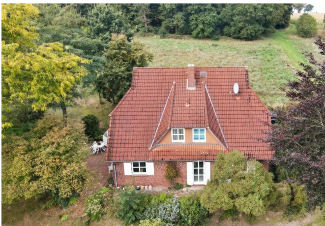
Ansicht von der Seite