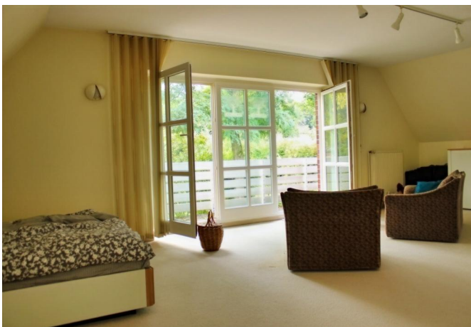
Schlafzimmer mit Balkon