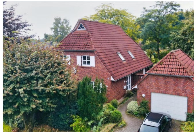
Eingangsbereich mit Garage