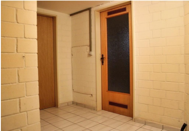
Flur im Keller