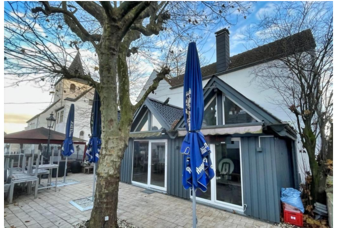
Nikolaus Häuser Terrasse