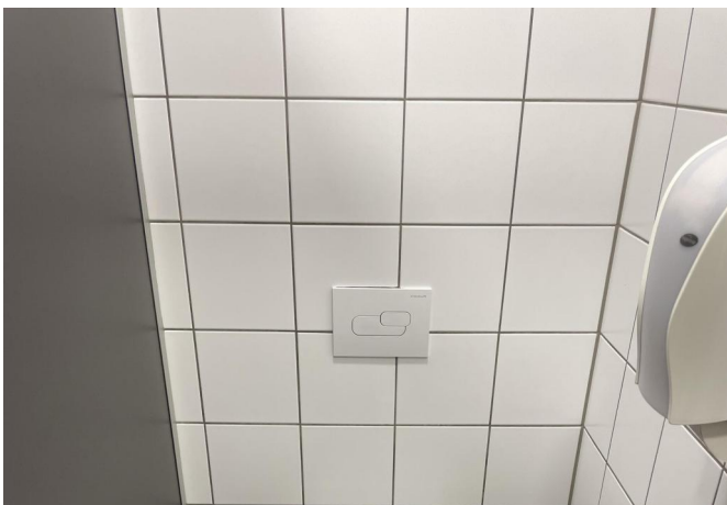
WC Terrasse/ Servicegebäude