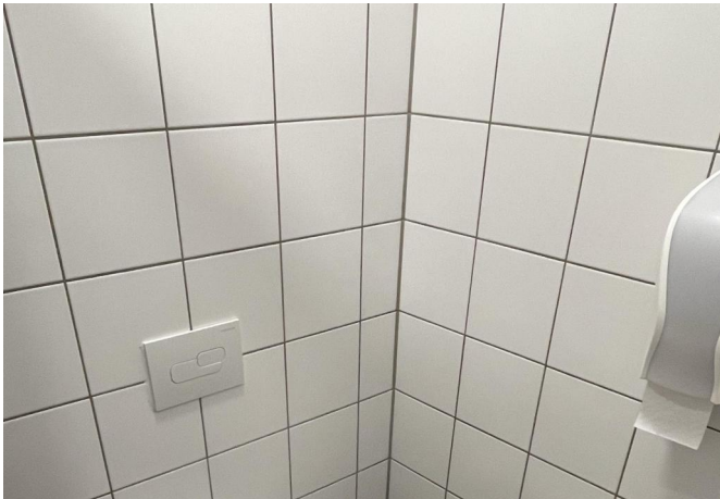
WC Terrasse/ Servicegebäude