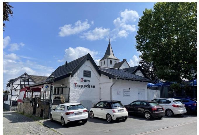
Servicegebäude + Parkplätze