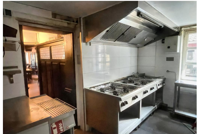
Küche Erdgeschoss Haupthaus