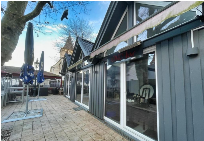
Nikolaus Häuser Terrasse