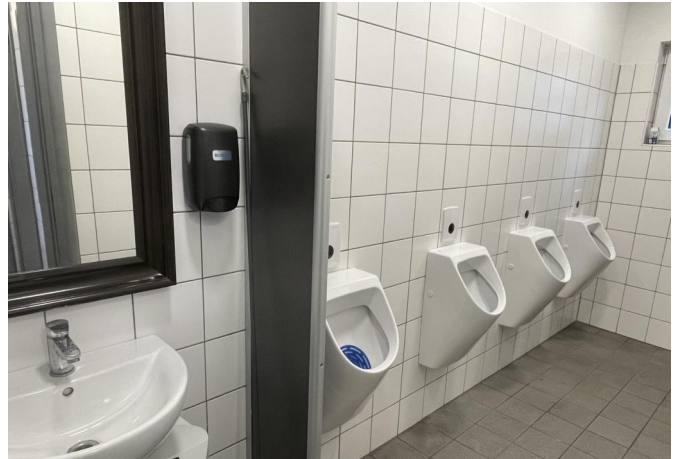
WC Terrasse/ Servicegebäude