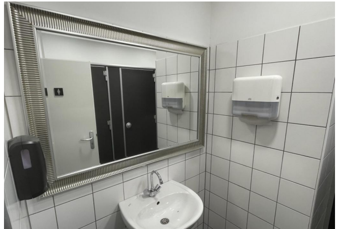
WC Terrasse/ Servicegebäude