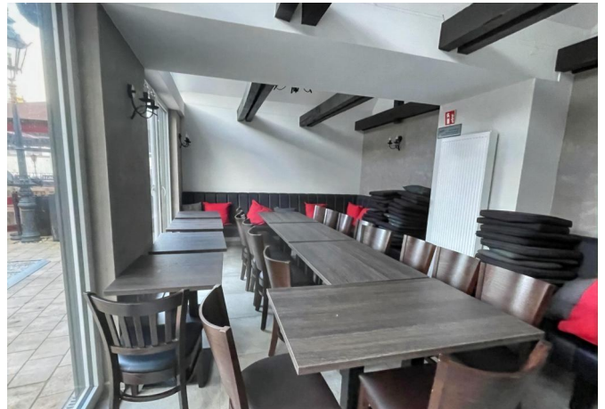
Nikolaus Häuser Terrasse