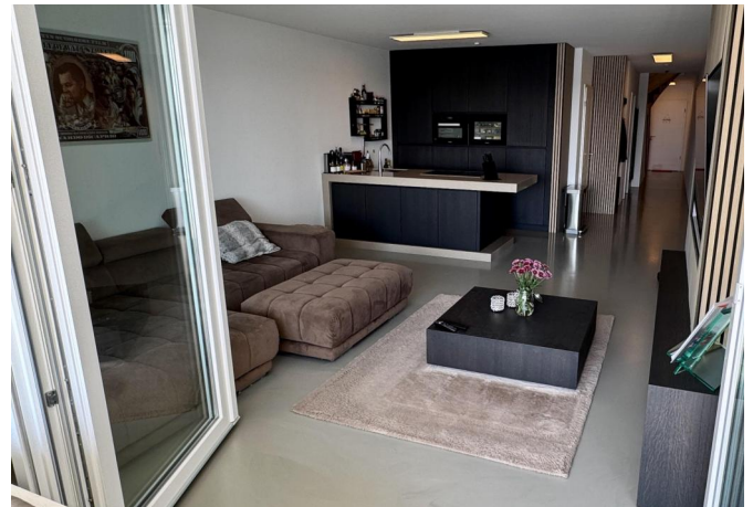
Große Fensterfront Wohnzimmer