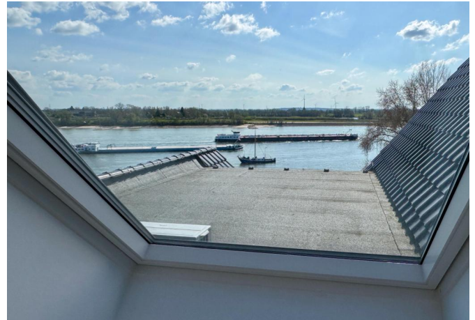
Ausblick Zimmer II oben