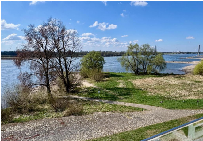
Loggia & Ausblick