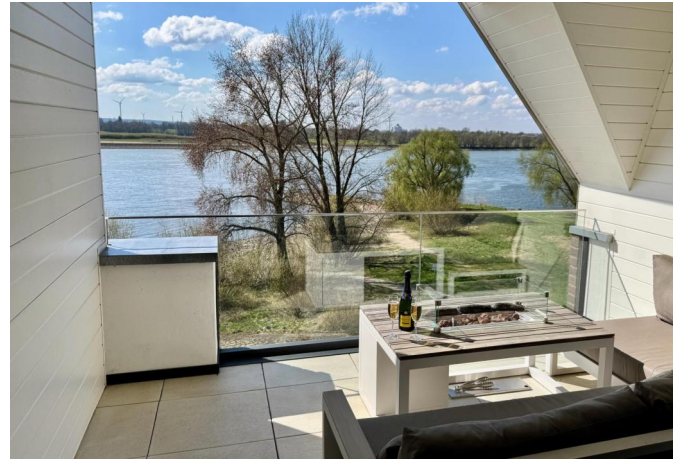
Loggia & Ausblick