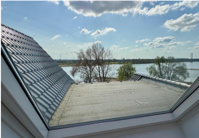
Ausblick Zimmer I oben