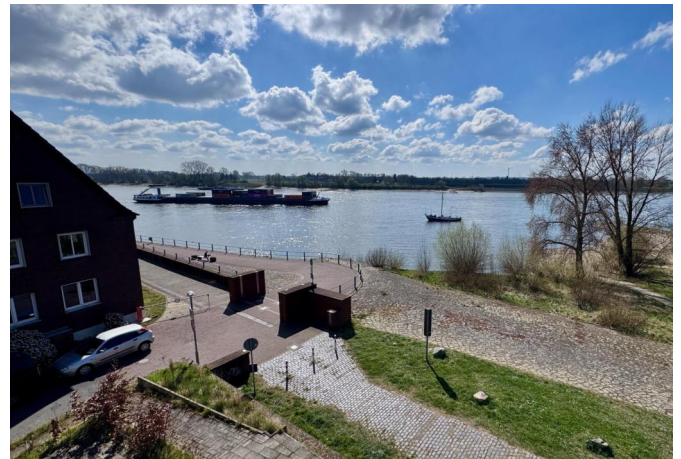
Loggia & Ausblick