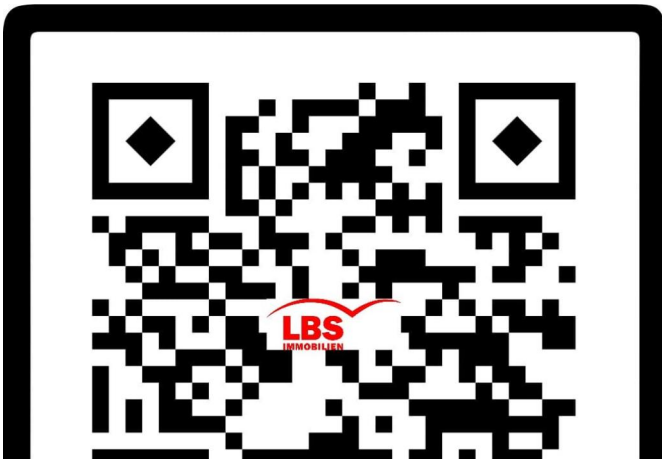
Rundgang & Video