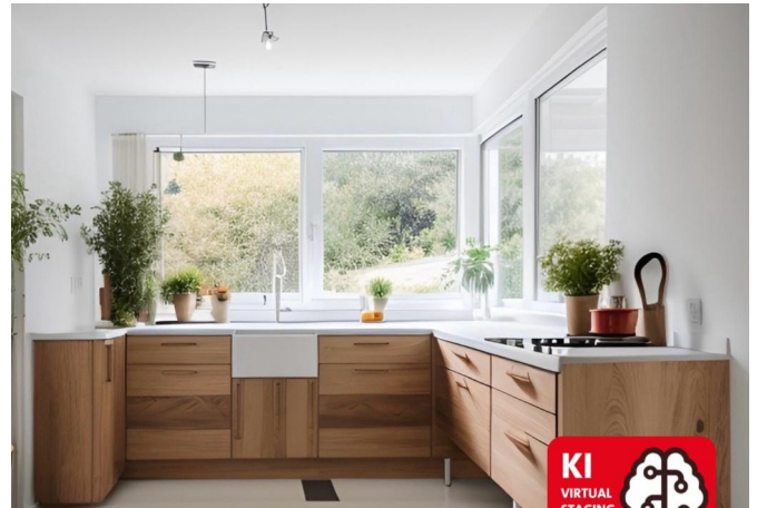
Wohnbeispiel 1 Küche