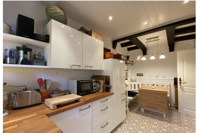
Küche mit Essecke