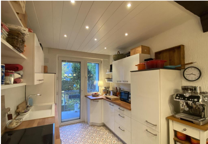
Küche mit Balkon-/Gartenzugang