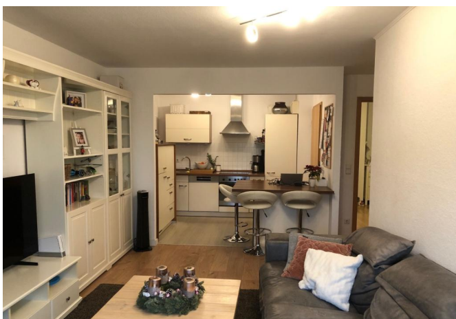
Wohnzimmer mit Küche