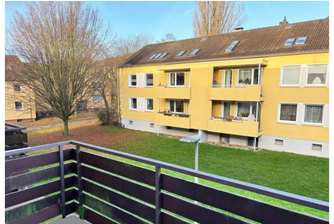
Aussicht aus Schlafzimmer 2