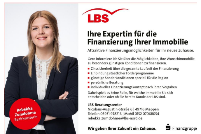
Exposeanzeige Zumdohme Meppen