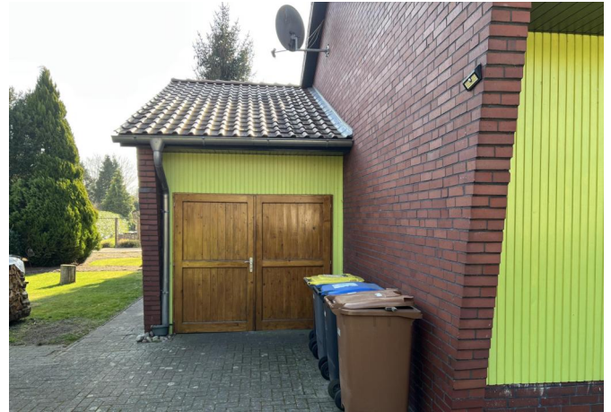
Garage / Werkstatt