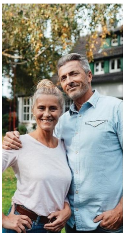
Walker dei Immobilienprofi